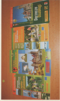
Ścieżki rowerowe Euroregionu Pradziad PHARE CBC