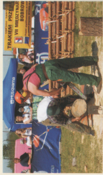
Międzynarodowe Zawody Drwali w Bobrowie INTERREG IIIA