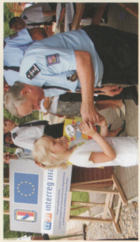
Promocja bezpiecznej turystyki przygranicznej INTERREG IIIA