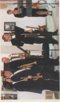
Linhartovské kulturní léto Město Albrechtice INTERREG IIIA