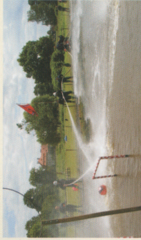
Międzynarodowy turniej piłki wodnej PHARE CBC