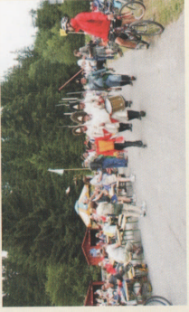
Lesní slavnost k záchramě hradu Kobřístejn Spolek přátel Vrbenska INTERREG IIIA