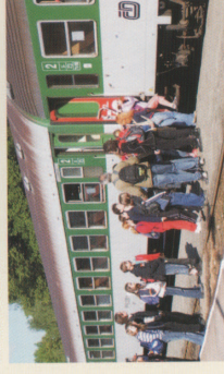
Vlakem za poznáním partnerského města Nysy - Město Jeseník INTERREG IIIA