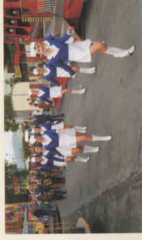
Dny Euroregionu Praděd - Vrbenské slavnosti Vrbno pod Pradědem INTERREG IIIA