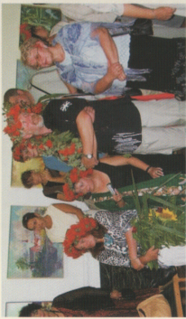
Międzynarodowy Plener Malarski 2006 Gmina Strzeleczki oczami artystów INTERREG IIIA