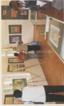
Mezinárodní výtvárný plenér Život Krnova pohledem zvenčí - Město Krnov INTERREG IIIA