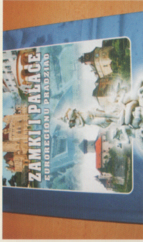
Zamki i Pałace Euroregionu Pradziad PHARE CBC