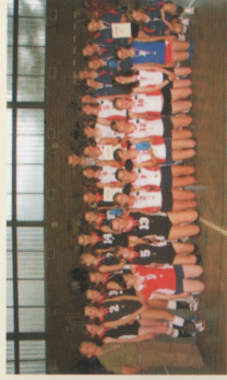
Euroliga Piłki Siatkowej Dziewcząt PRADZIAD II PHARE CBC