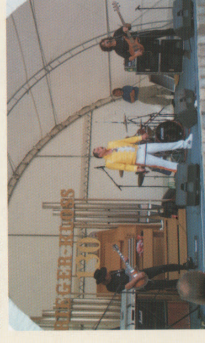
Krnovské Hudební slavnosti Krnov INTERREG IIIA