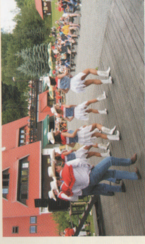
Jeseník se baví MKZ Jeseník INTERREG IIIA