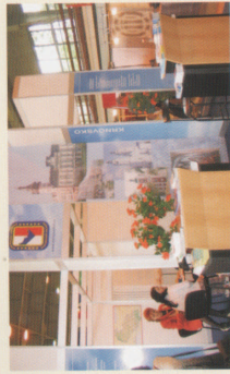
Společnou cestou k rozvoji Euroreg. Praděd Euroregion Praděd - česká část INTERREG IIIA