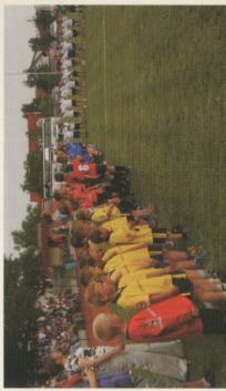
Mundial Przedszkolaków o Puchar Pradziada 2006 INTERREG IIIA