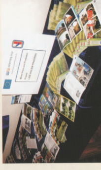
Lidé kolem Pradědu Město Vrbno + Grogówek INTERREG IIIA