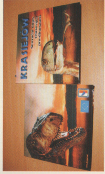
Rozwój turystyki w Gminie Ozimek PHARE CBC