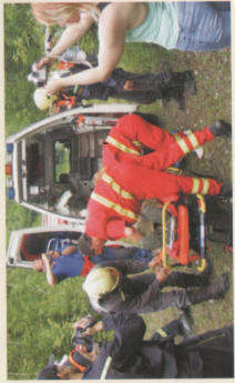
Společná česko-polská cvičení hasičských sborů - obec Bláh Voda INTERREG IIIA