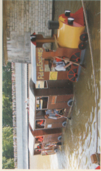
Odra rzeka integracji europejskiej Pływadło 2006 INTERREG IIIA